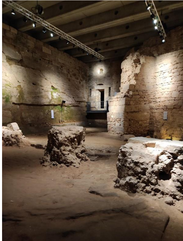
Das Museum von innen gesehen, wobei oben auf der Treppe die Sonderausstellung und unten die Dauerausstellung zu sehen ist.