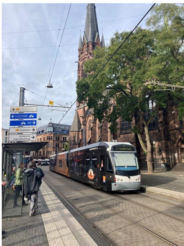
Tramway en direction de Siedlerheim à partir de l'arrêt église Saint Jean

⇒ Photo 360° : https://goo.gl/maps/YZ7KvFSUYHabnqD19