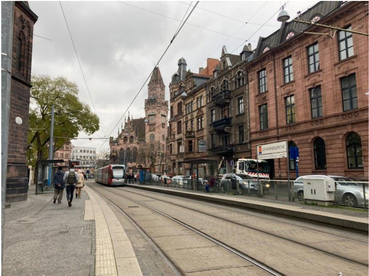
Image de paysage de l'arrêt église Saint-Jean

L'arrêt église Saint -Jean/ Mairie se trouve dans la Cecilienstraße. L'arrêt s'appelle ainsi parce qu'il se trouve juste devant l'église et à côté de la mairie. L'arrêt a 5 destinations différentes à partir de l'arrêt église Saint-Jean (vers Siedlerheim, vers Riegelsberg Süd, vers Heusweiler Markt et vers Lebach). Tous les trains vont dans le sens nord. En montant à l'arrêt église Saint-Jean, on peut prendre les bus urbains à l'arrêt Mairie(lignes 101, 02, 103, 104, 105, 106, 107, 109, 110, 111, 121, 122, 125, 129 et 150).