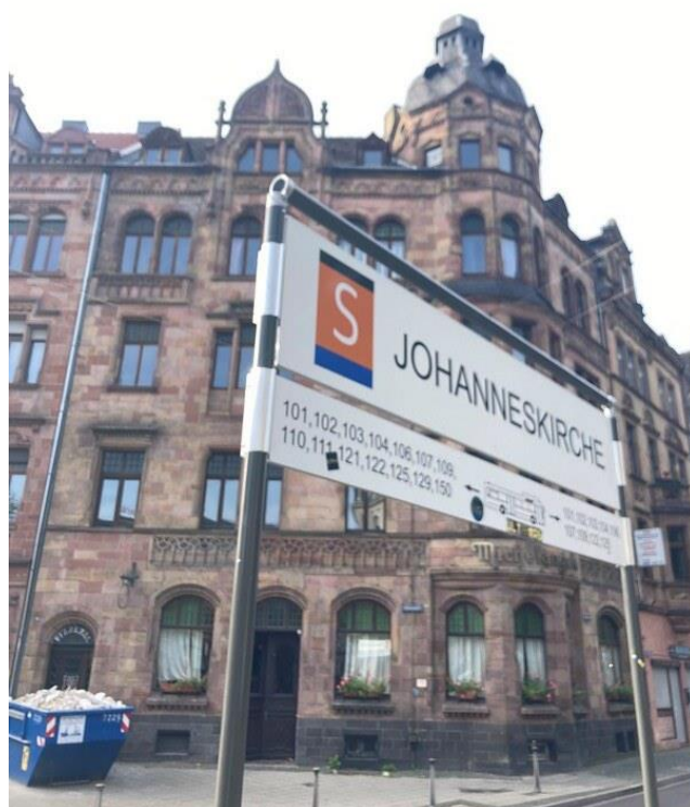
Panneau de l'arrêt église Saint - Jean