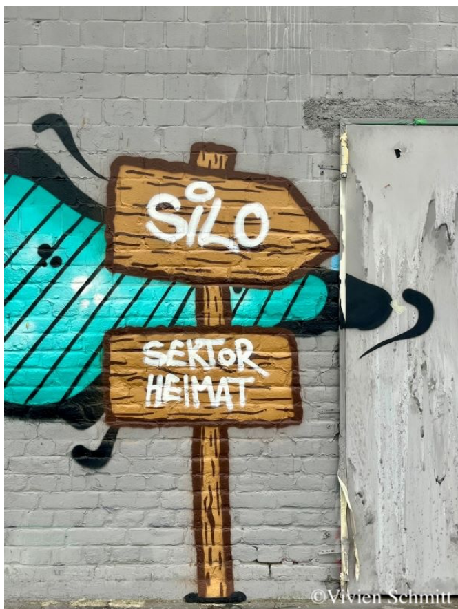
Extérieur du Silodom

Vous aimez la techno et vous voulez faire du rap jusqu'à l'aube? Alors vous êtes au bon endroit au Silodom ! De nombreux amateurs de techno s'y retrouvent et peuvent partager des nuits inoubliables dans un lieu impressionnant.