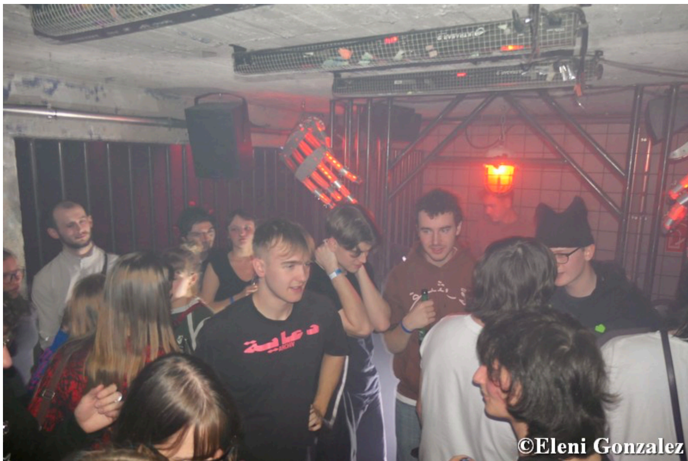
Fête de 2010 au Blau Nachtclub

L'ambiance du club est aussi variée que l'offre musicale ! Que ce soit du rap allemand, des hits des années 2010 ou de la techno, il y en a vraiment pour tous les goûts. Sur trois pistes de danse au total, on peut apprécier différents genres de musique. Le club propose un programme varié qui ne cesse d'enthousiasmer les fêtards.