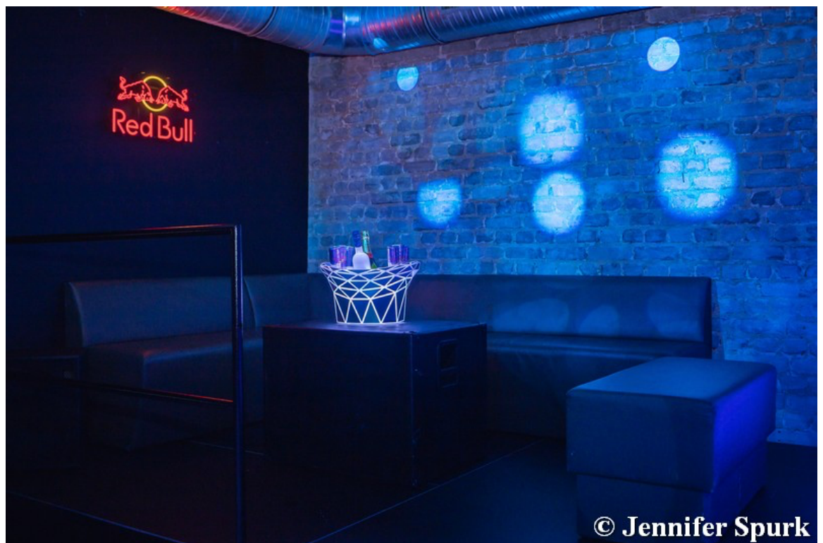
Lounge des Loose Clubs