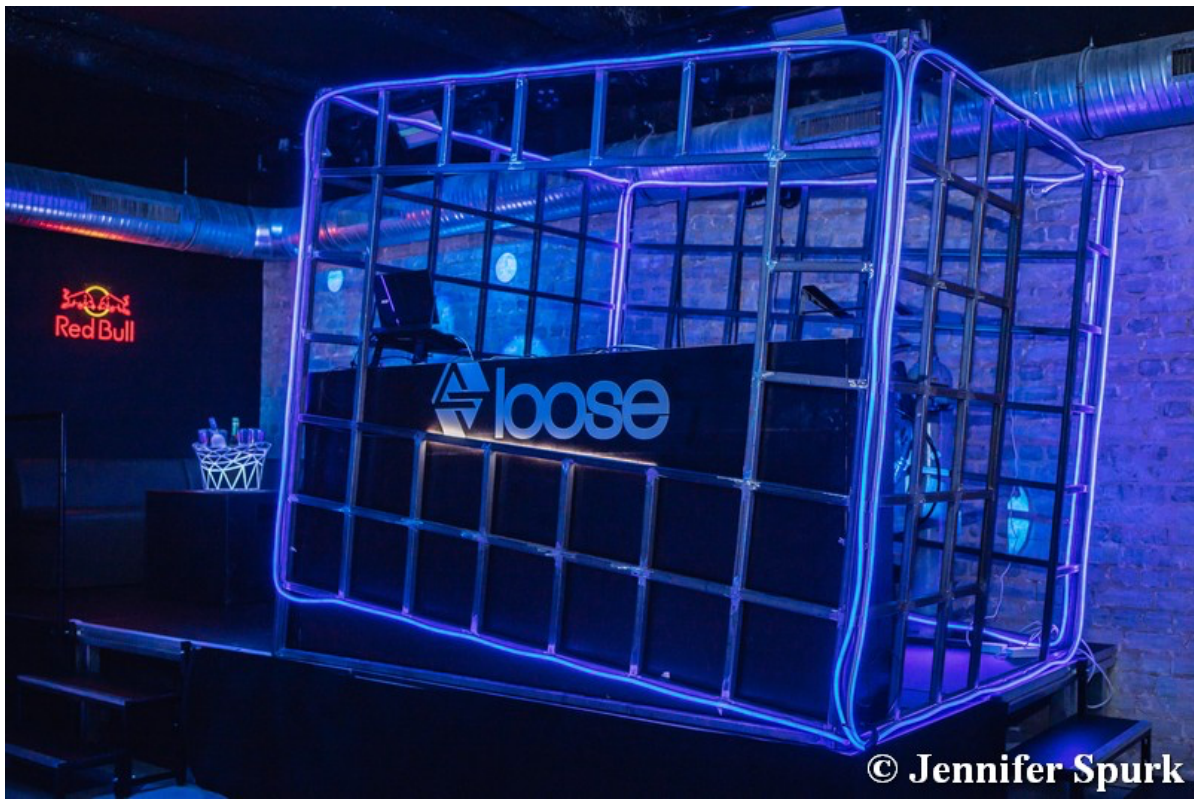
Lounge des Loose Clubs