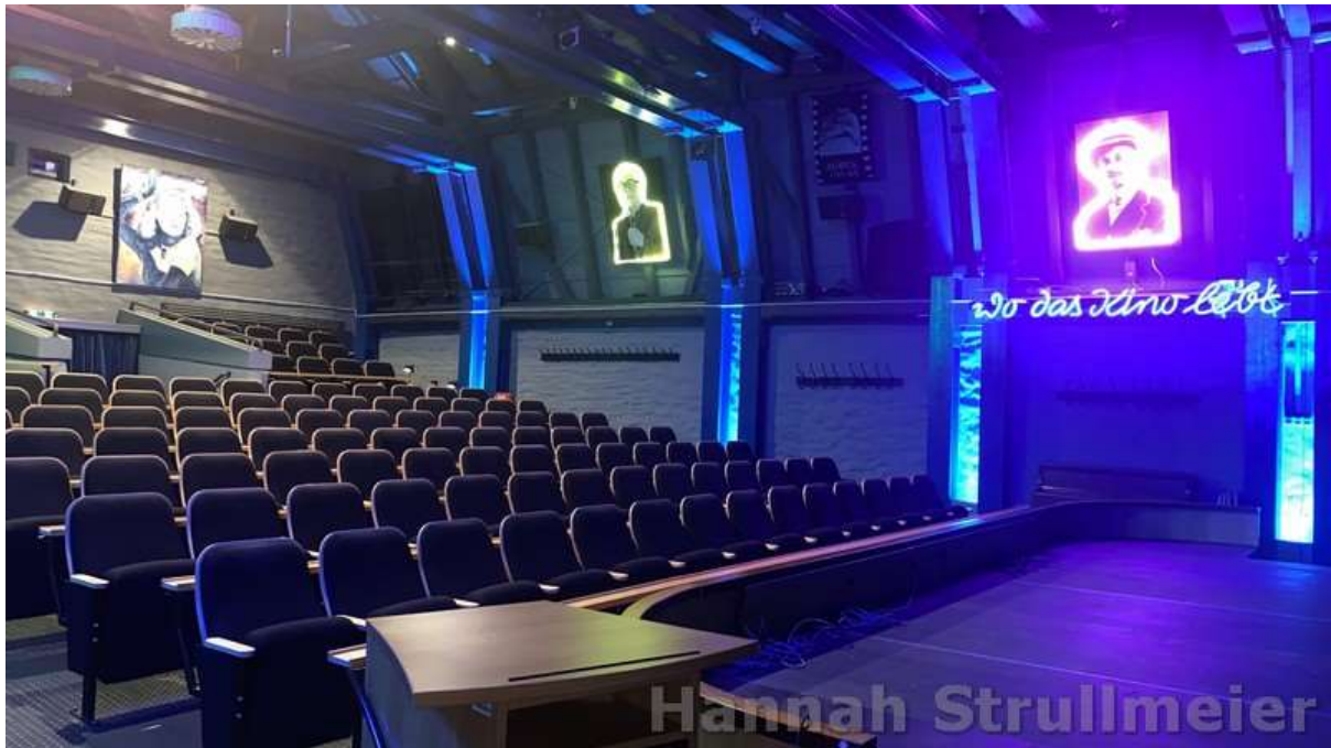
La salle de Filmhaus

Pour conclure, on peut dire que la Filmhaus vaut définitivement le détour et qu'elle offre de nombreuses possibilités différentes, même si l'on n'a pas forcément envie d'aller voir un film.