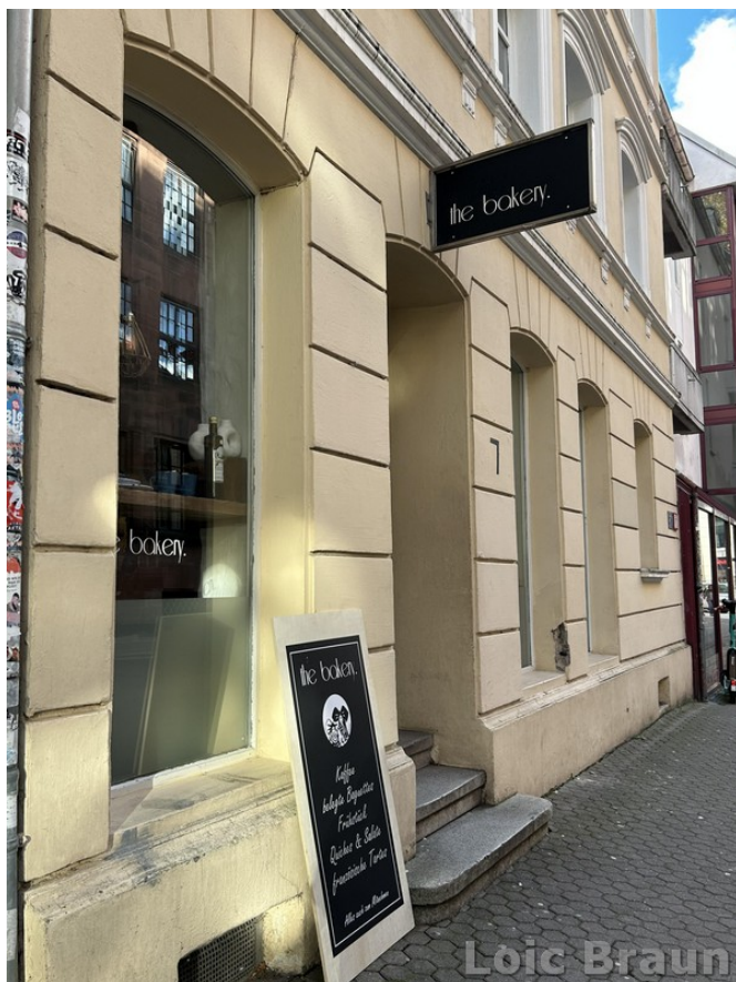
„The Bakery.“ : L'image montre la façade du café.

Est un café situé dans le centre (Gerberstr. 7, 66111 Saarbrücken). Spécialisé dans les petits déjeuners, brunchs et déjeuners, il est adapté aux plats végétariens, végétaliens et sans gluten.