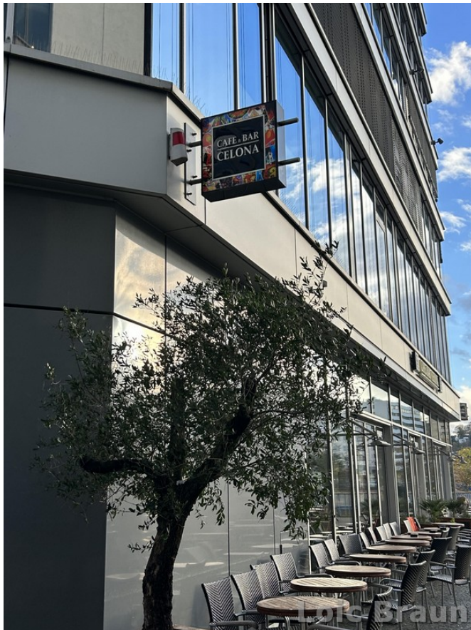
Café & Bar Celona : sur cette photo, on voit la façade et la terrasse du Celona.

Le Café & Bar Celona se trouve sur la Berliner Promenade (Berliner Promenade 5, 66111 Saarbrücken). Il est connu pour la variété de ses boissons et de ses plats. Il est ouvert toute la journée et sert tous les repas, du petit-déjeuner au déjeuner, en passant par le dîner et les cocktails. Le petit-déjeuner et le café sont très appréciés par les habitants.