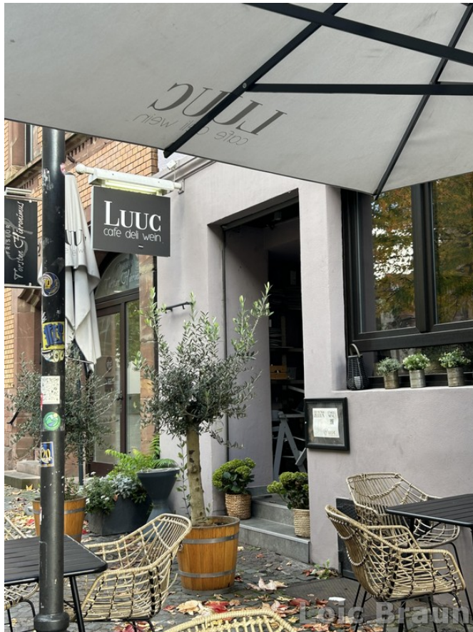
LUUC : sur la photo, on voit la terrasse et l'entrée du café LUUC.

Est un café – bar situé au centre de Sarrebruck (Türkenstr. 17, 66111 Saarbrücken). Ouvert du lundi au mercredi de 9h30 à 20h30 ; jeudi et vendredi de 9h30 à 22h ; samedi de 9h30 à 22h et dimanche de 9h30 à 20h30.