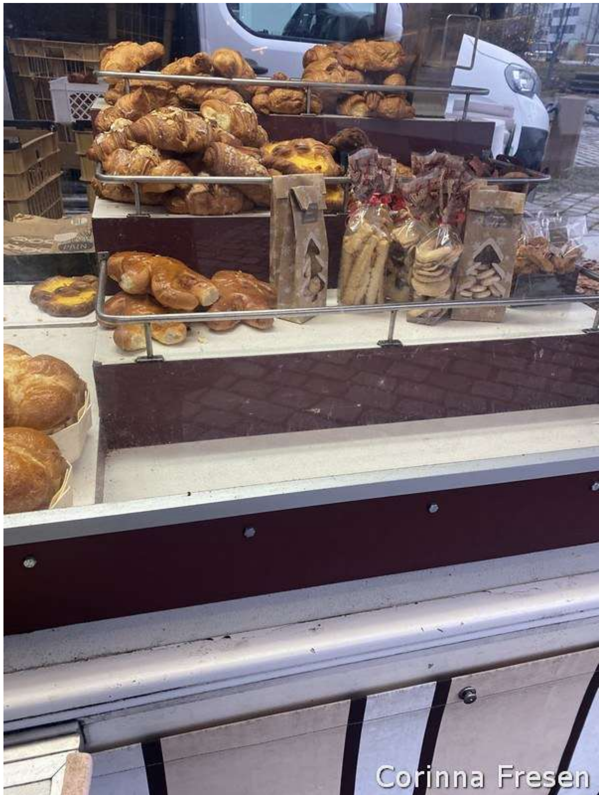
Assortiment de pâtisseries (croissant en pâte d'amande, biscuits, morceaux de pudding) du boulanger de Sarreguemines

Le marché hebdomadaire de la Ludwigskirche n'est pas seulement un lieu de shopping, mais aussi un lieu de rencontre pour la communauté locale. Ici, vous pourrez échanger des idées avec les commerçants et peut-être apprendre une ou deux recettes secrètes de la cuisine régionale.