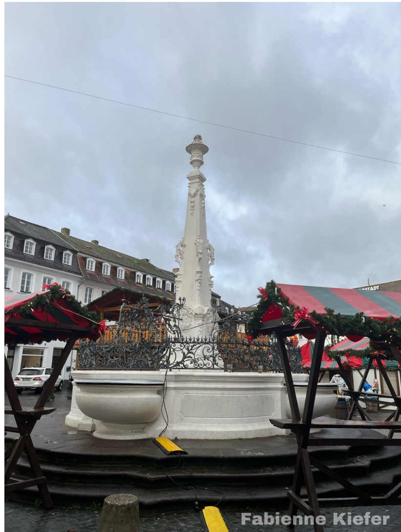
Stengelbrunnen am St.Johanner Markt

Der Stengelbrunnen am St. Johanner Markt im Herzen von Saarbrücken eignet sich perfekt als Treffpunkt für Dates. In direkter Umgebung befinden sich viele Bars und Restaurant in denen man sich gut unterhalten kann. Es bietet sich aber auch die Möglichkeit für einen Spaziergang an der Saar entlang bis hin zum Staden.