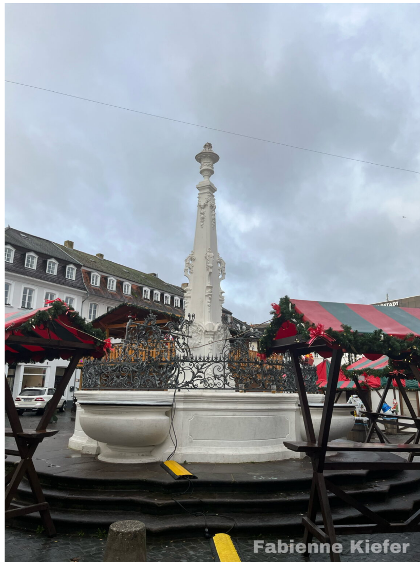
Stengelbrunnen am St.Johanner Markt

Il est également possible de se promener le long de la Sarre jusqu'au Staden. Tu peux voir un itinéraire possible pour une promenade sur cette carte.