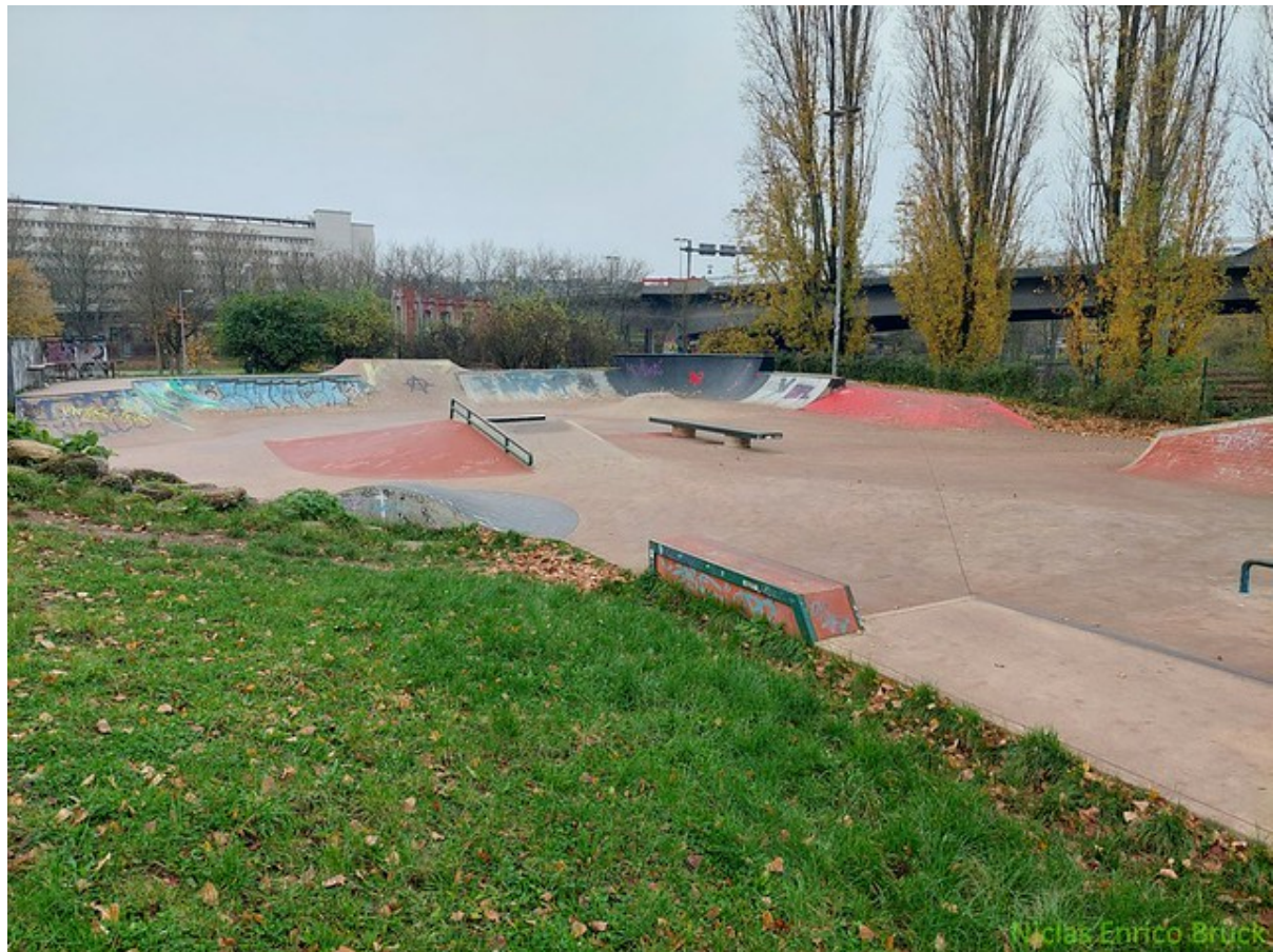
Übersicht über den Skatepark

Der Skatepark verfügt über eine breite Auswahl an Hindernissen. Der Eingangsbereich verfügt über eine gekurvte Rampe die sich über die komplette Breite des Parks erstreckt. Neben einer großen Fun-Box mit Rail und Kicker Rampe befindet sich mittig eine Ledge für Grinds.